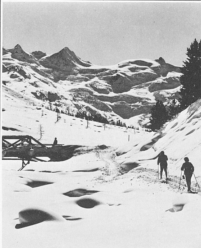
Skiwandern im Val Roseg, mit Sellagruppe, Pontresina

Auskunft und Prospektmaterial: Kurverein Arosa, 7050 Arosa Telefon 081 31 16 21