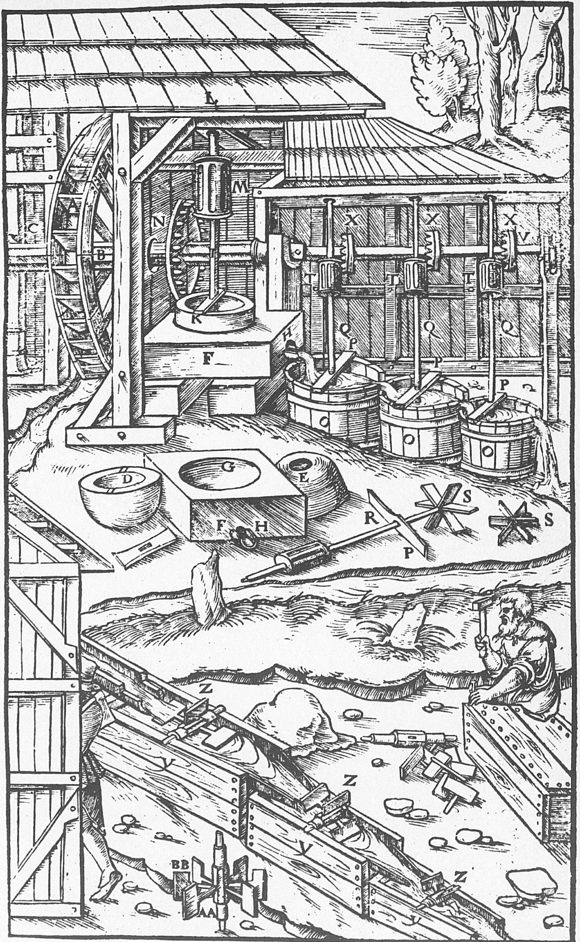
Holzschutte aus dem Werk von Georg Agricola: «De re metallica», Basel, Frobenius 1553