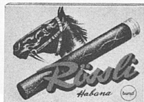
10 / 3.- würzig-mild