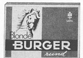
10 / 3.- mild