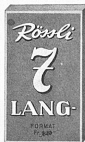
10 / 2.20 extra preiswert