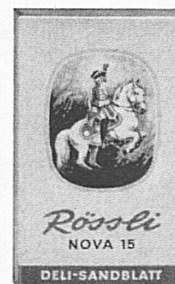
10 / 2.40 sehr leicht