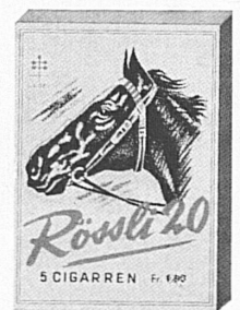
5 / 2.20 Spitzenqualität