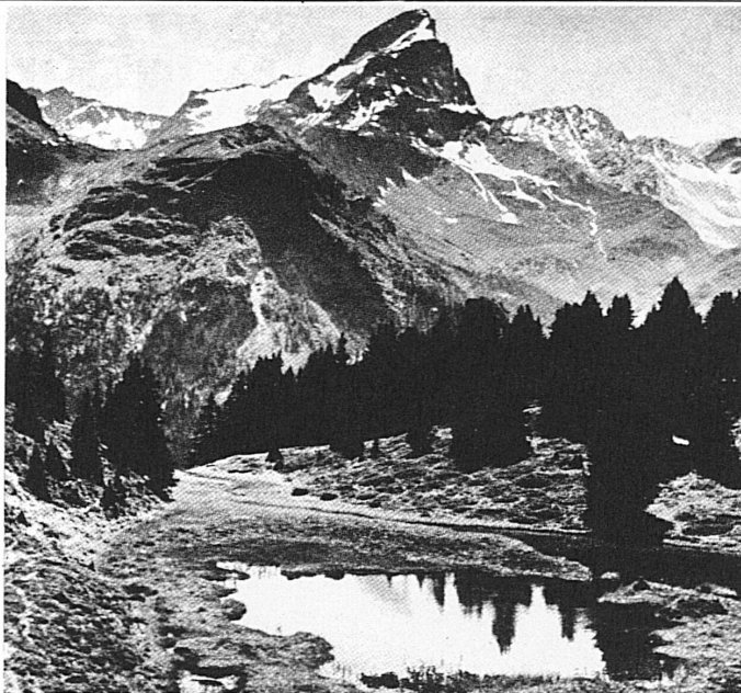
Alp Flix mit Piz Platta, Oberhalbstein.

Auskunft und Prospekte: Ihr Reisebüro oder Verkehrsverein, Postfach 198, 7270 Davos Platz