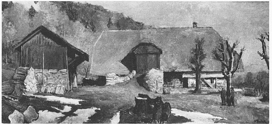
Bern im Winter, 1971/72