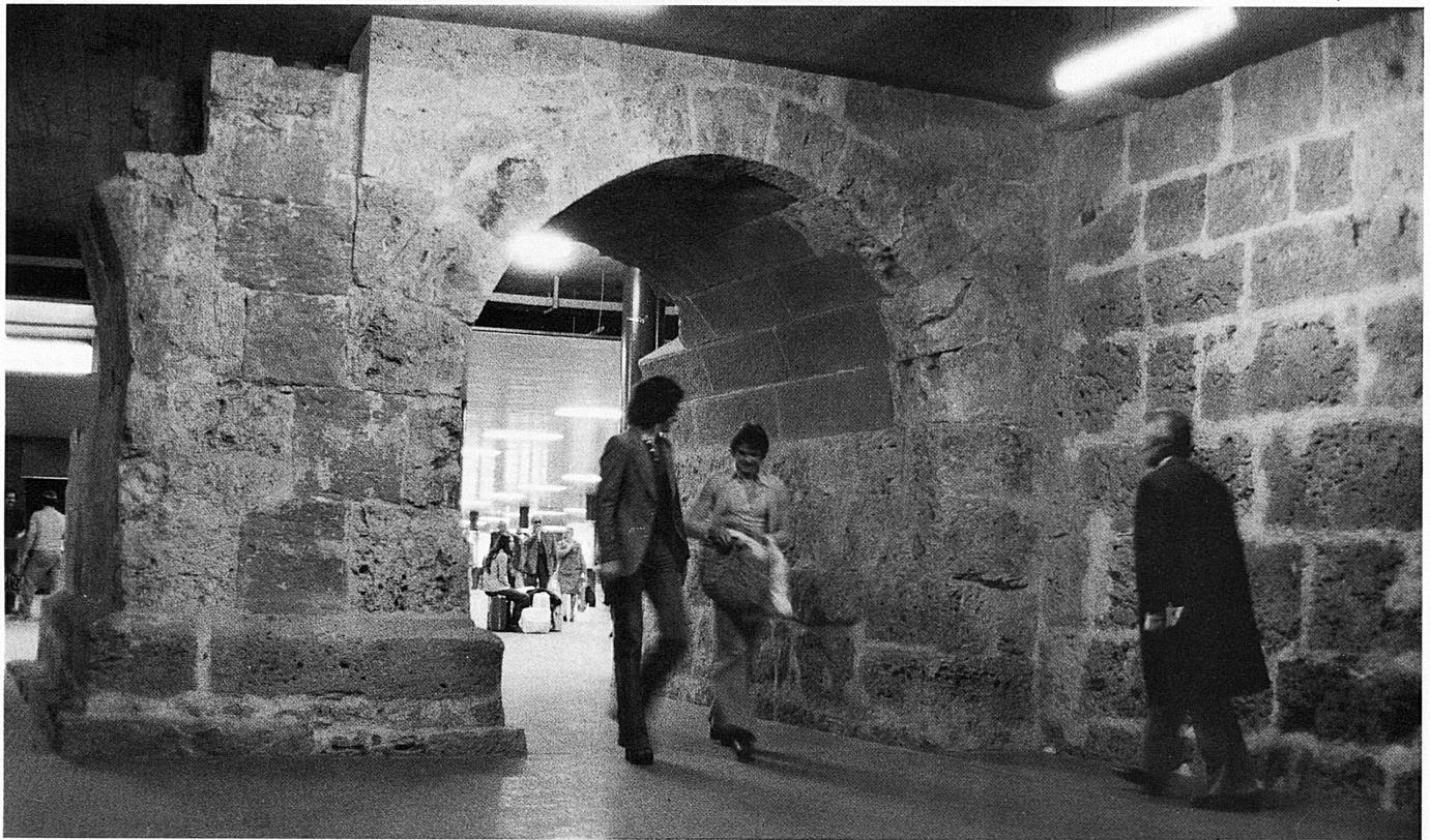
Die Fundamente des Christoffelturms und der Grabenbrücke wurden 1972 freigelegt, konserviert und in die neue, 1975 vollendete Bahnhofunterführung integriert.

Les fondations de la tour Christophe et de la Grabenbrücke ont été mises à jour en 1972, puis conservées et intégrées dans le passage sous-voïe de la gare terminée en 1975