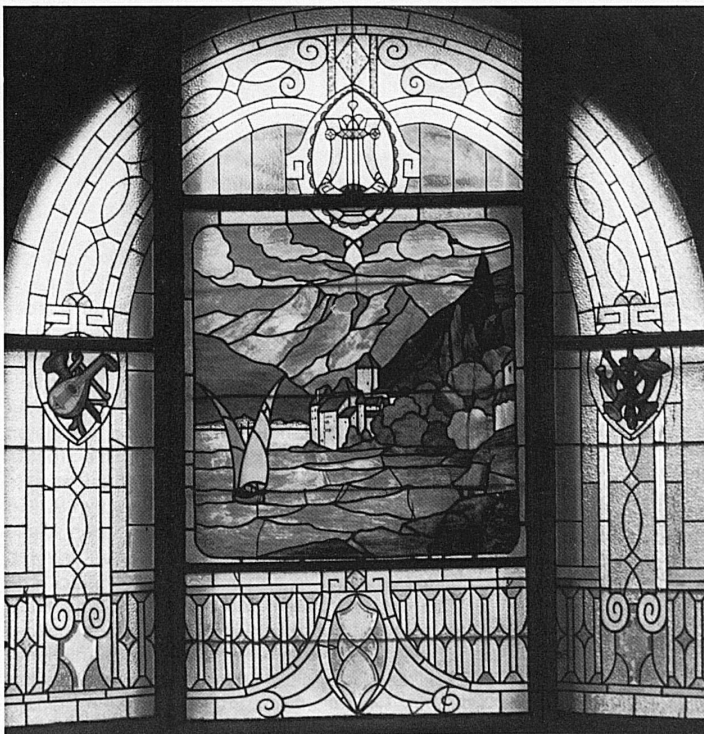
Schloss Chillon am Genfersee, einst Burg der Bischöfe von Sitten und der Grafen von Savoyen, ist mit dem aufkommenden Tourismus zum Inbegriff der Schweizer Schloslandschaft geworden: So erscheint es – wenn auch seitenverkehrt – im Glasfenster eines Wohnhauses in Lodz unweit von Warschau (Anfang 20. Jahrhundert).

Pentagonal arcade courtyard in Aubonne Castle, Canton of Vaud, once the seat of the Aubonnes, officers of the house of Savoy. The splendid pillared courtyard was built in the early 18 th century