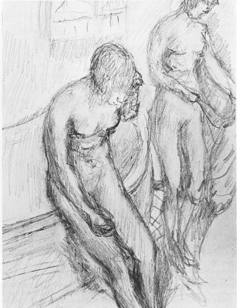
Pierre Bonnard: Nus dans la salle de bains. Vers 1933

A group of 125 drawings by the French painter Pierre Bonnard (1867–1947) will be on show in the exhibition hall of the museum throughout the summer until September 26. The works, from the collection of Alfred Ayrton, are being shown for the first time in Europe, following temporary exhibitions in the United States and Canada. The direct and spontaneous style of the drawings, which are partly drafts and sketches for Bonnard's oil paintings, is an expression of the attractive and delightful world of the artist.