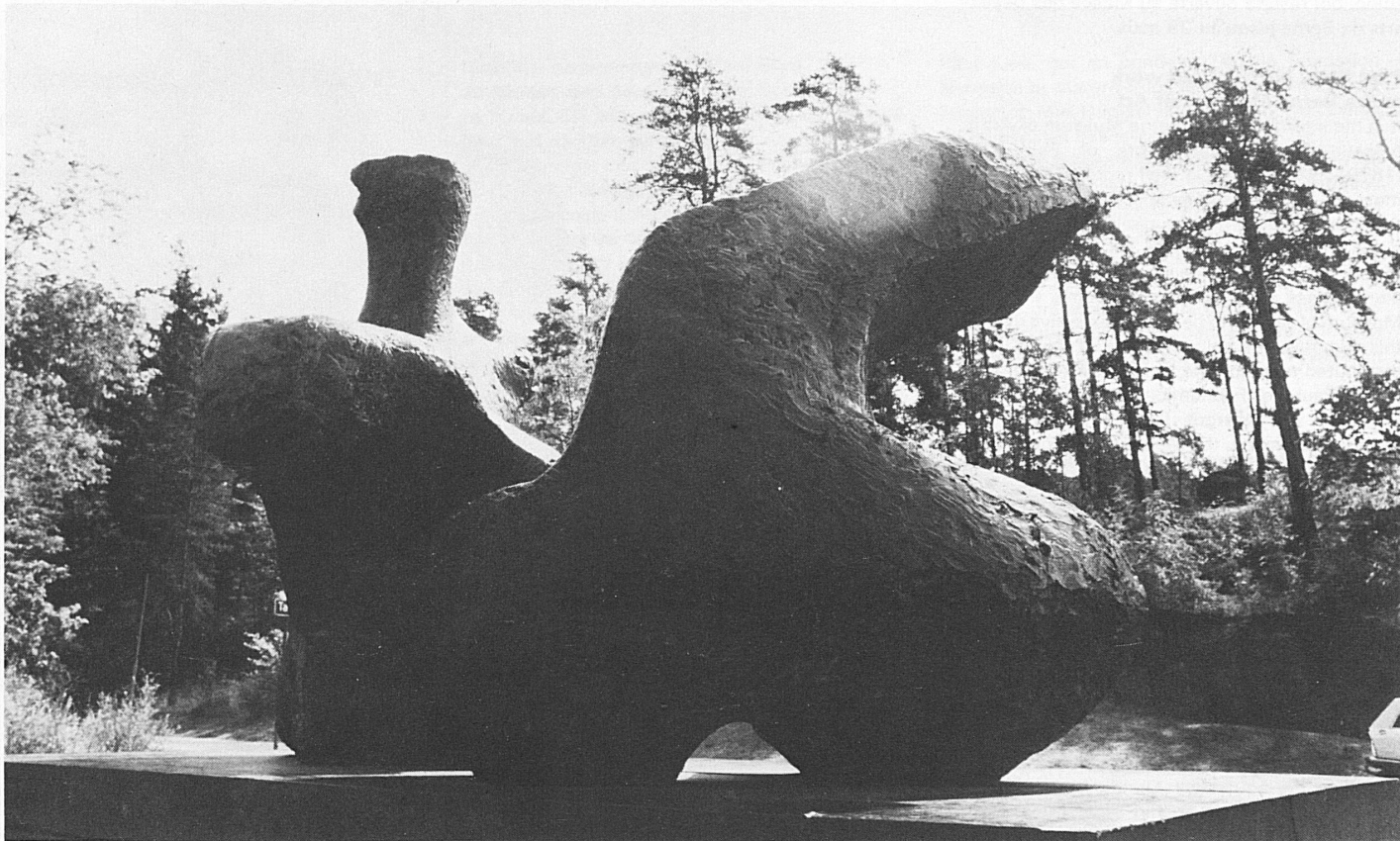
Henry Moore.

The contribution of Henry Moore to the sculpture of the present century is of quite outstanding importance. By the interaction of the abstract and the organic, his work acquires a significance which makes plastic art comprehensible to the general public. Henry Moore is personally involved in the organisation of the Zurich exhibition. His collaboration has made possible the assembly of an exceptional number of works, large and small, to afford an insight into the entire period of his output from 1924 to 1976.