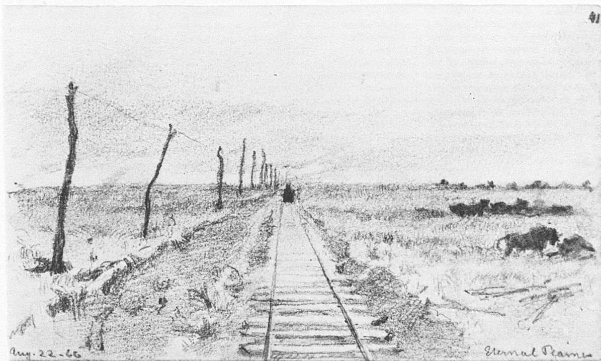
Frank Buchser: «Eternal Plains», Bleistift, Kunstmuseum Basel, Kupferstichkabinett. Das Bild ist 1866 auf Buchsers Reise in den Westen entstanden und zeigt einen Abschnitt der 1869 vollendeten Pazifikbahn (siehe auch Seiten 48/49)

Literatur: Bundesblatt; H. Lüdeke: Frank Buchsers amerikanische Sendung, Basel 1941; H. Würmli: Frank Buchser in Amerika, Ausstellungskatalog Schlösschen Bleichenberg, Biberist, 1975; Julia Gauss: Ein Künstler auf diplomatischer Extratour, Sonderdruck aus Bd. 72 der «Basler Zeitschrift für Geschichte und Altertumskunde», 1972.