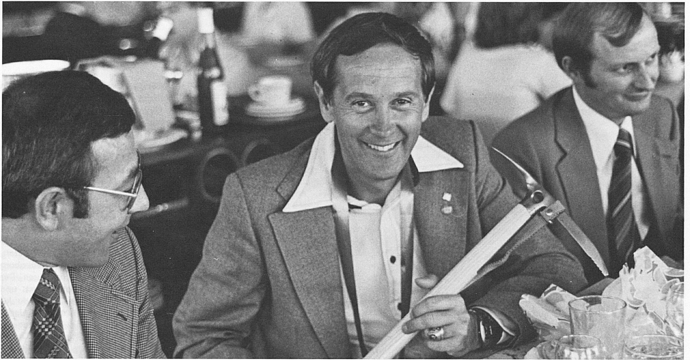
ASTRONAUTENBESUCH IM SCHWEIZER PAVILLON VISITE D'ASTRONAUTES AU PAVILLON SUISSE

Der von der Schweizerischen Verkehrszentrale und der Schweizerischen Zentrale für Handelsförderung organisierte Schweizer Pavillon an der Ausstellung "Man and his World" in Montreal hatte grossen Erfolg. Die dort zu Besuch weilenden amerikanischen Astronauten E. Cernan (Apollo 10) und Ch. Duke (Apollo 11) wurden mit einem "Ehren"-Gletscherpickel beschenkt.