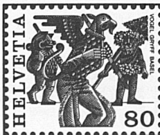
Vogel Gryff Basel