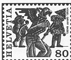
Vogel Gryff Basel