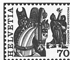
Processione di Mendrisio