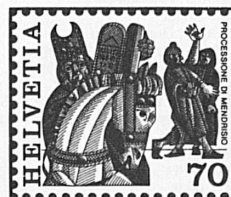
Processione di Mendrisio