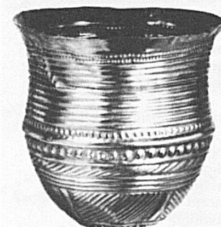
Goldbecher aus Eschaz TG Um 1700 v. Chr.

Kunstsammlung im Haus Sonnenberg, Ringstrasse 16: Geöffnet Sa und So von 14 bis 17 Uhr. Eintritt frei