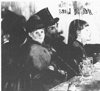
Edouard Manet, «Au café», 1878