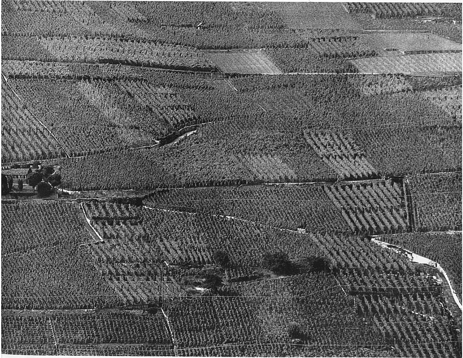
Die Kirche von Ligerz inmitten der Weinberge. Aufnahme von der Petersinsel aus

in dieser Gegend – und westlich dann weiter gegen Schafis hinunter, wo sein Name durch eine Haltestelle der Ligerz-Tessenberg-Bahn, die ihn dort überschneidet, verewigt ist. Da die Wallfahrtskirche zugleich als Gemeindekirche dienen musste, blieb sie erhalten.