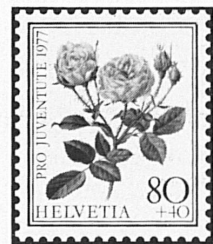
Rosa centifolia muscosa

Die Zeit der Rosen ist vergangen, Des Sommers Melodie verweht... Doch hier, im Markenbild gefangen, Der Rosen Schönheit neu erstet.