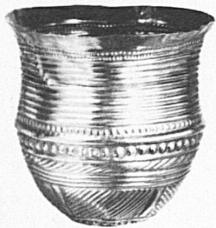
Goldbecher aus Eschenz TG Um 1700 v. Chr.