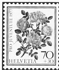
Rose foetida persiana