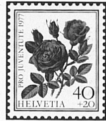
Rose à Parfum de l'Hay