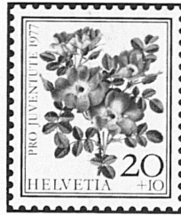
Rosa foetida bicolor