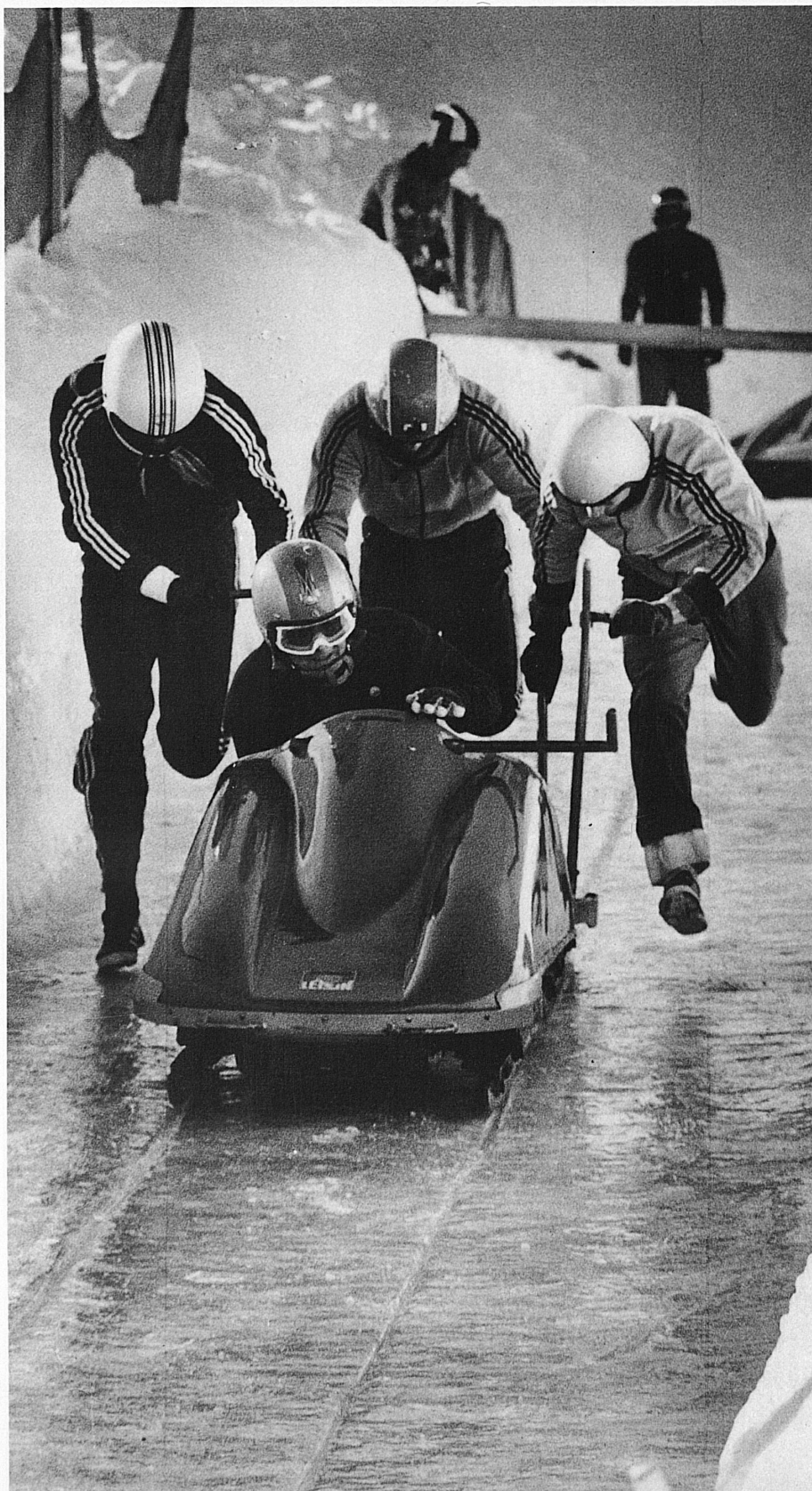
3/4 Wenn der Start nicht gelingt, kann auch der beste Pilot nicht gewinnen