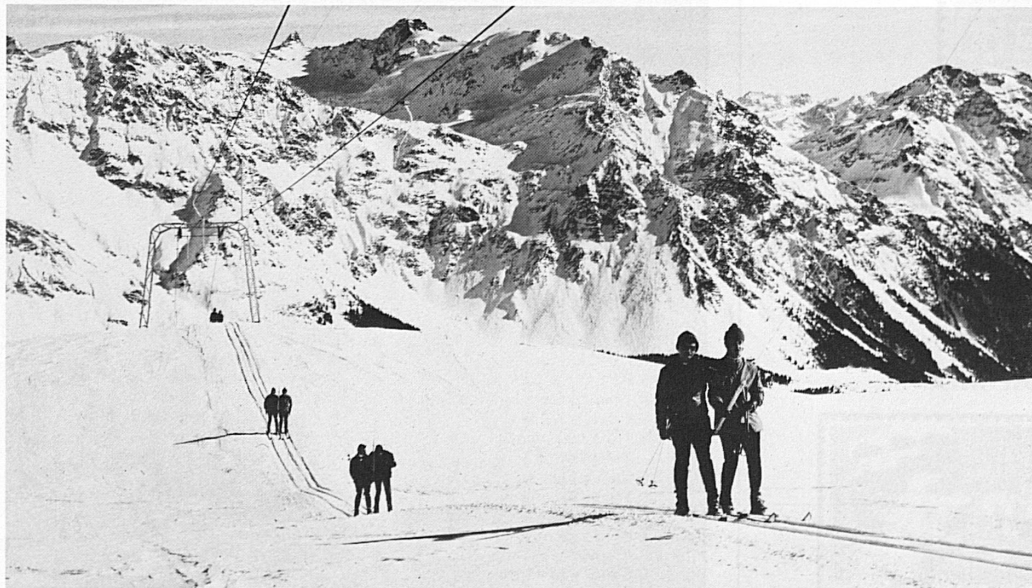
San Bernardino, Skilift Confon Basso

Auskunft und Prospekte sind beim Verkehrsverein für Graubünden, Ottostrasse 6, 7001 Chur, oder bei den lokalen Verkehrsvereinen erhältlich.