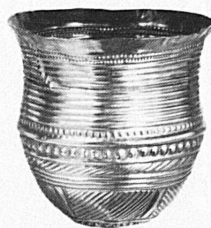
Goldbecher aus Eschenz TG Um 1700 v. Chr.

Spezialgeschäft für Frei- und Kabelleitungen jeder Art Schwebebahnen Trolleybus- und Bahnleitungen