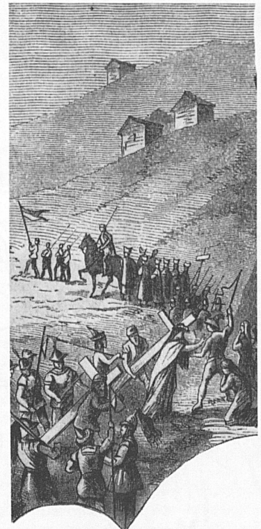
Passionsspiele Lumbrein, letztmals 1881