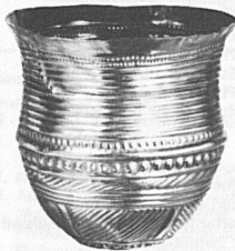
Goldbecher aus Eschenz TG Um 1700 v. Chr.

Telefon: Schloss (072) 6 18 66, Wohnung 6 13 23