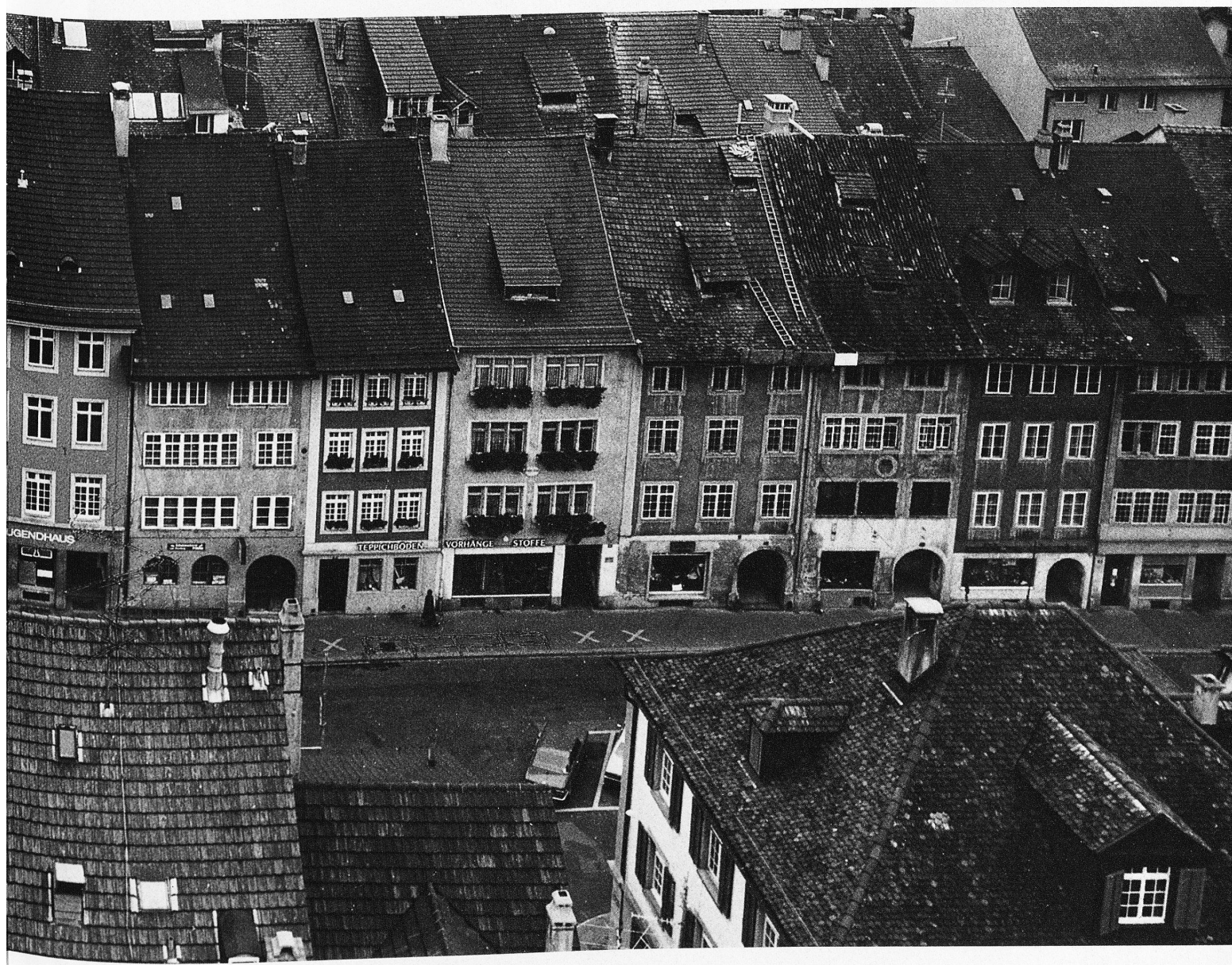
Almost every house in the Old Town has a name