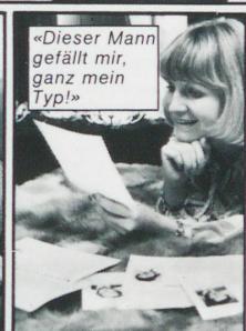
«Dieser Mann gefällt mir, ganz mein Typ!»