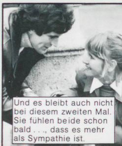
Und es bleibt auch nicht bei diesem zweiten Mal. Sie fühlen beide schon bald... dass es mehr als Sympathie ist.