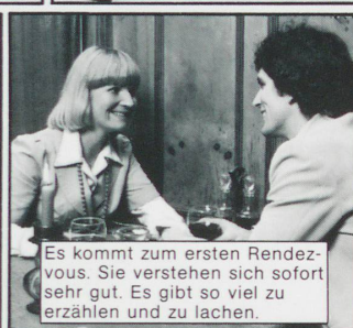
Es kommt zum ersten Rendez-vous. Sie verstehen sich sofort sehr gut. Es gibt so viel zu erzählen und zu lachen.