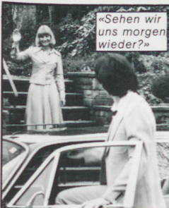
«Sehen wir uns morgen wieder?»