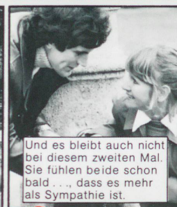
Und es bleibt auch nicht bei diesem zweiten Mal. Sie fühlen beide schon bald... dass es mehr als Sympathie ist.