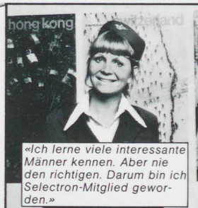
«Ich lerne viele interessante Männer kennen. Aber nie den richtigen. Darum bin ich Selectron-Mitglied geworden.»