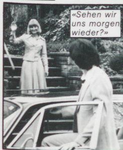
«Sehen wir uns morgen wieder?»