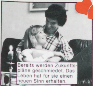
Bereits werden Zukunftspläne geschmiedet. Das Leben hat für sie einen neuen Sinn erhalten.