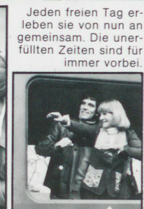
Jeden freien Tag erleben sie von nun an gemeinsam. Die unerfüllten Zeiten sind für immer vorbei.