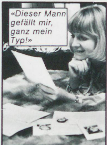
«Dieser Mann gefällt mir, ganz mein Typ!»