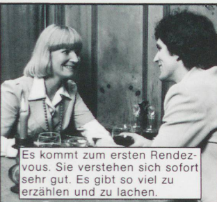
Es kommt zum ersten Rendez-vous. Sie verstehen sich sofort sehr gut. Es gibt so viel zu erzählen und zu lachen.