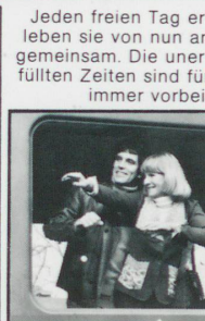
Jeden freien Tag erleben sie von nun an gemeinsam. Die unerfüllten Zeiten sind für immer vorbei.