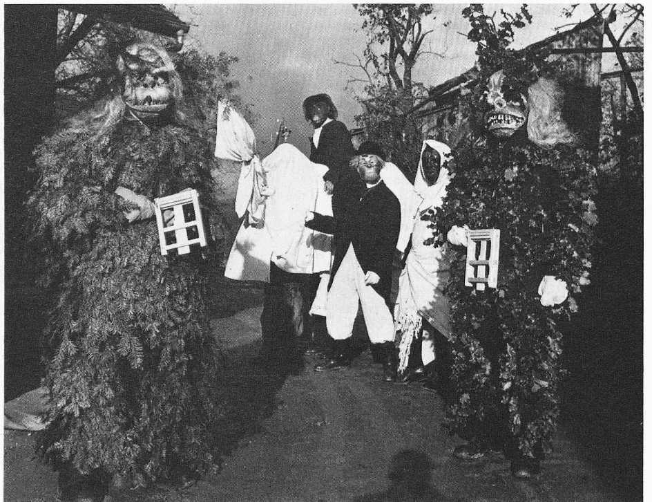
«Bärzeli-Tag» mit Umzug in Hallwil AG

Seit 1956 hat Interlaken seine «Harder-Potschete» am zweiten Tag im neuen Jahr wieder aufgenommen. Der Harderberg gilt übrigens als Zuflucht der Zwerge. So jagen denn der «Chriesmarti», der «Tannzappler» und die «Hobelspäppler» hinter dem Hardermannli her. Merligen am Thunersee kennt an diesem Tag einen Lärmzug der ledigen Burschen, und in Schwanden, oberhalb Sigriswil, ist das «Wurst- und Geldheischen» Trumpf, wobei die Gruppe von einem roten Teufel angeführt wird.