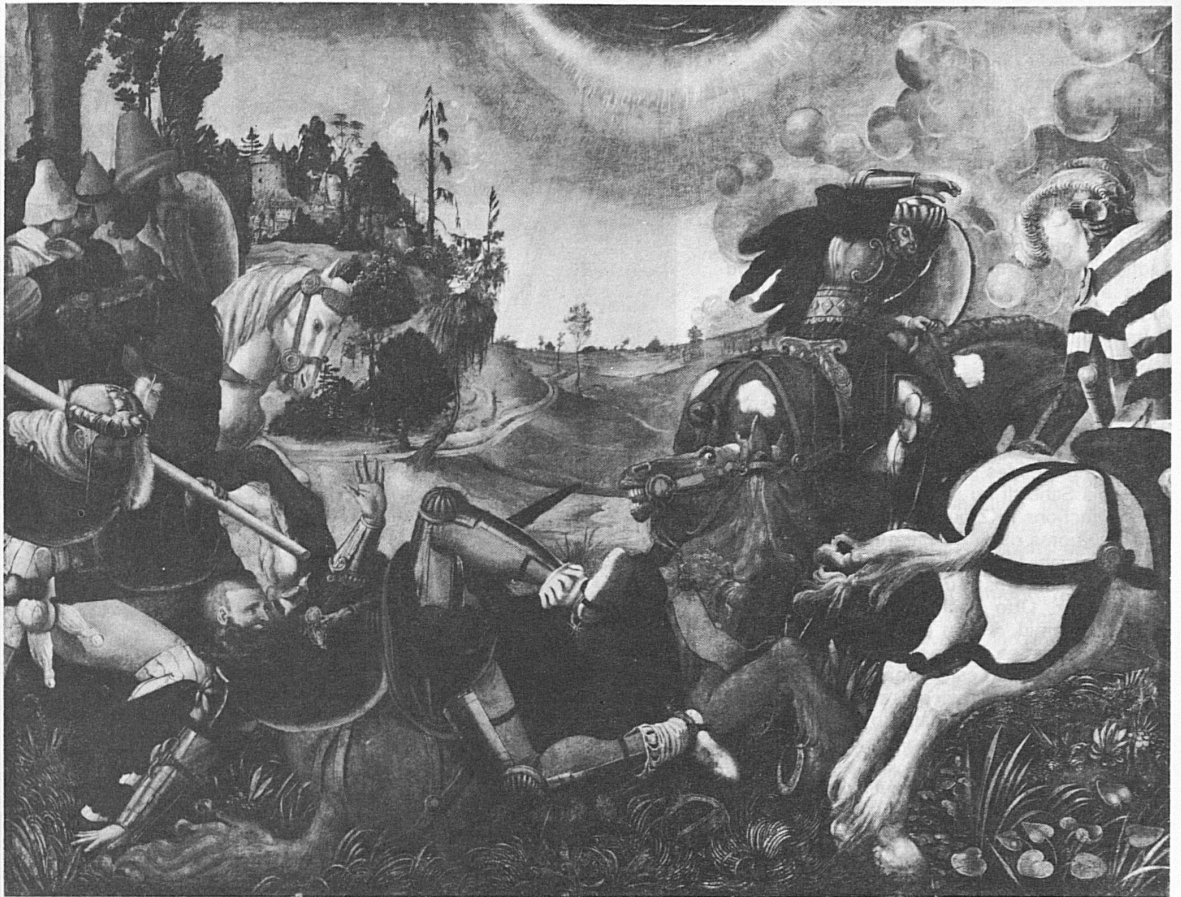
Die Bekehrung des Saulus, 1516–1517