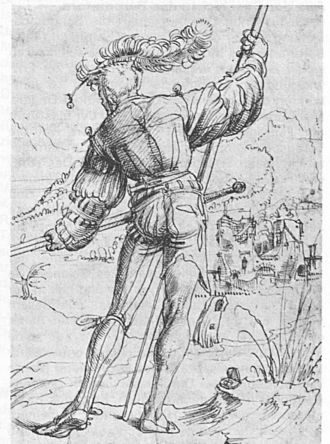
Rückfigur eines Eidgenossen. Um 1513/14