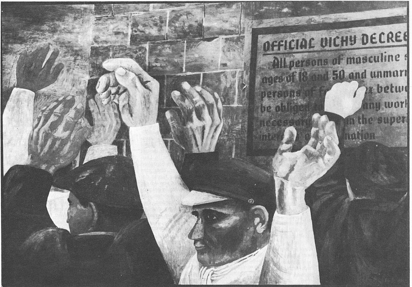
Ben Shahn: Französische Arbeiter, 1942

Bridge", which was looked on as the "Eiffel Tower of New York". The works of Charles Demuth and Charles Sheeler portray sober reality to the exclusion of humanity, in which American industrial worlds appear as pictorial items in purist form. Edward Hopper illustrates everyday items, such as a woodland filling station in the evening or a half-empty cinema, while Ben Shahn and Ivan Albright gave expression to social critiques. Pictures by the young Willem de Kooning and Mark Tobey testify to the beginnings of Tachism. The exhibition in Zurich has been considerably enlarged by the compilation of more than 300 pictures by the 40 most famous American photographers (Alfred Stieglitz, Edward Weston, Paul Strand, Ansel Adams, Imogen Cunningham and others). Reproductions of reality in various aesthetic manifestations illustrate contemporary history and personalities of that decade (Greta Garbo, Rudolph Valentino, Gloria Swanson). 20 exclusive models of American haute couture from the collection of the New York Metropolitan Museum can also be seen for the first time in Europe. In conjunction with the exhibition, ten American films are to be shown in the lecture room of the Art Gallery during the period from October 19 to 28. These will include "Mr. Deeds goes to Town" (Frank Capra, 1936), "Angel" (Ernst Lubitsch, 1937), "Stagecoach" (John Ford, 1939) and "Rebecca" (Alfred Hitchcock, 1940). Until October 28