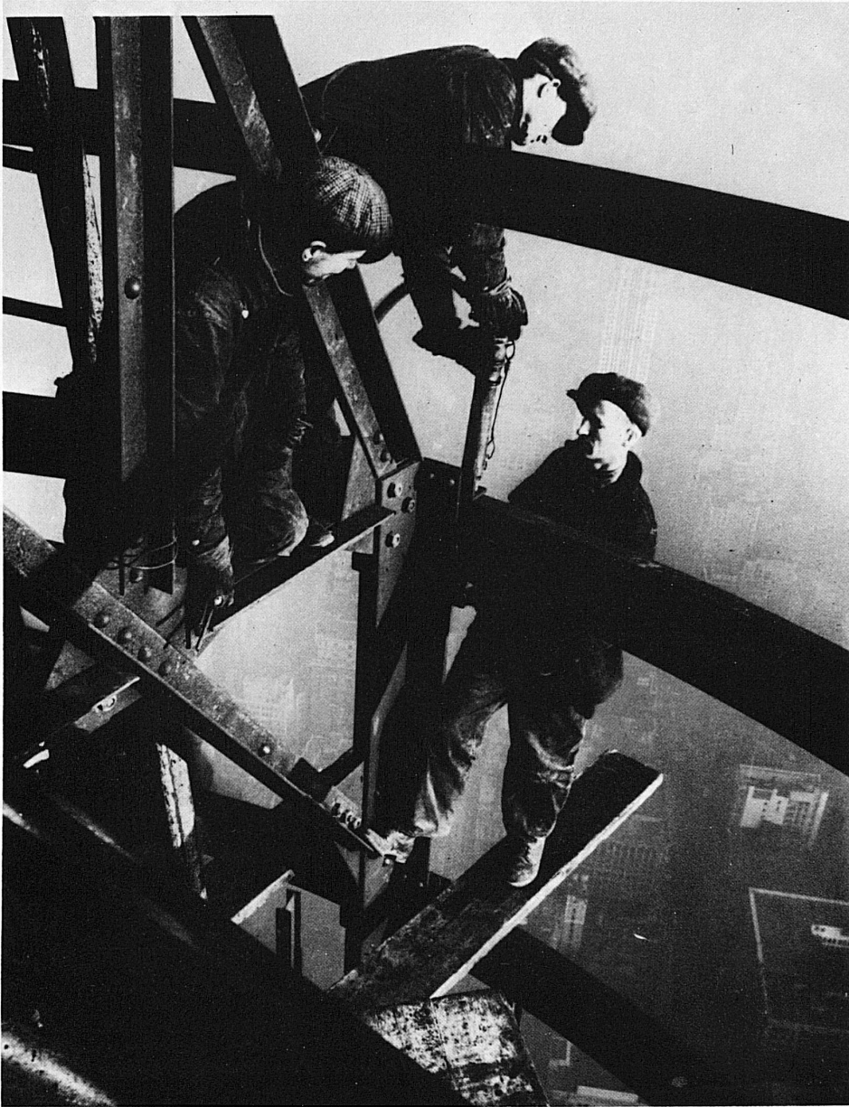
Lewis Wickes Hine: Empire State Building, 1930

Dem entscheidenden Abschnitt moderner Kunstgeschichte in den USA – der Epoche zwischen den beiden Weltkriegen – ist der grosse Überblick gewidmet, den das Kunsthau Zürich gemeinsam mit der Kunsthalle Düsseldorf und dem Palais des Beaux Arts in Brüssel erarbeitet hat. Amerikas Kunstentwicklung in den 1920er und 1930er Jahren ist bei uns so gut wie unbekannt, und auch die im Herbst 1977 vom Europarat organisierte Schau «Tendenzen der zwanziger Jahre» übergang glattweg dieses Stück Kunstgeschichte in den USA. Um so bedeutender ist nun die gegenwärtige Veranstaltung für Europa zu werten, der hier eigentliche Aufklärungsfunktion zukommt. Die konzentrierte Präsentation – rund 170 Leihgaben aus mehr als 75 öffentlichen und privaten Sammlungen der USA – beleuchtet das Schaffen von 18 Künstlern, die gewissermassen die Kernmannschaft der amerikanischen Avantgarde darstellen. Die Bestan-