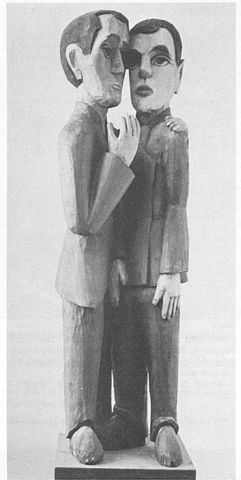
Ernst Ludwig Kirchner: Die zwei Freunde. 1926/26