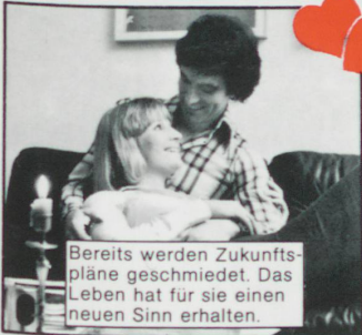
Bereits werden Zukunftspläne geschmiedet. Das Leben hat für sie einen neuen Sinn erhalten.