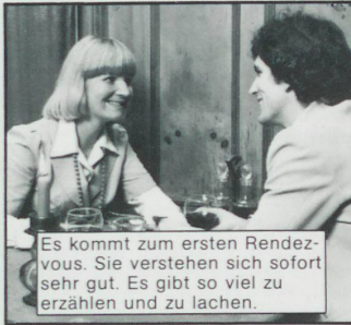
Es kommt zum ersten Rendez-vous. Sie verstehen sich sofort sehr gut. Es gibt so viel zu erzählen und zu lachen.