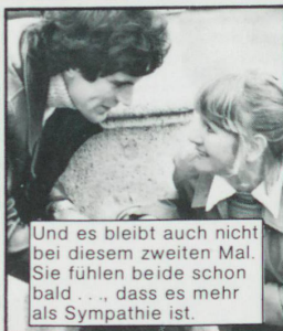
Und es bleibt auch nicht bei diesem zweiten Mal. Sie fühlen beide schon bald ... dass es mehr als Sympathie ist.

Jeden freien Tag erleben sie von nun an gemeinsam. Die unerfüllten Zeiten sind für immer vorbei.