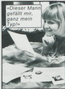
«Dieser Mann gefällt mir, ganz mein Typ!»