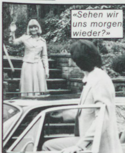
«Sehen wir uns morgen wieder?»