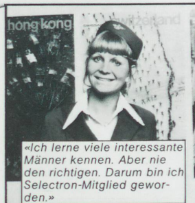
«Ich lerne viele interessante Männer kennen. Aber nie den richtigen. Darum bin ich Selectron-Mitglied geworden.»