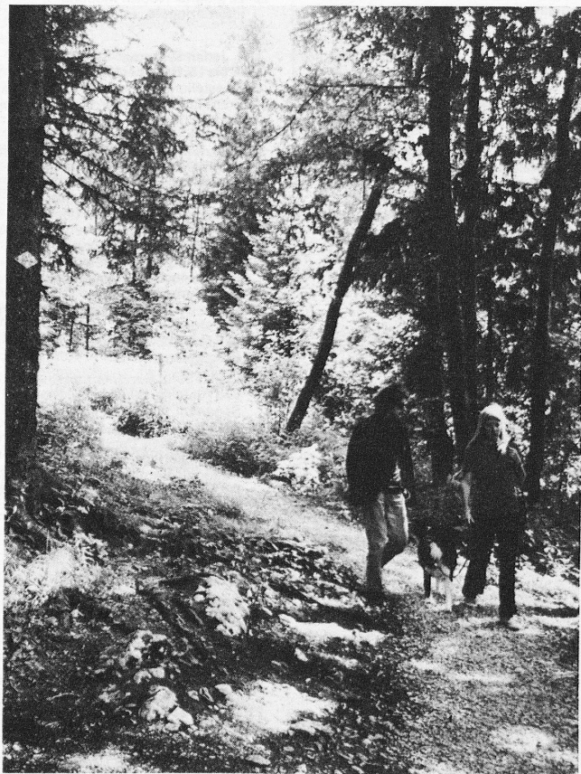
«Sentier pédestre du Jura neuchâtelois»