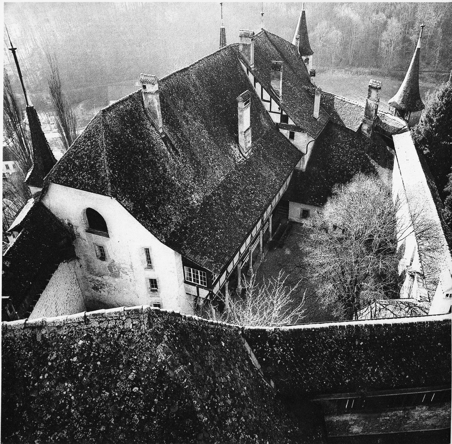
Blick vom Bergfried auf den Schlosshof (26) und vom Wehrgang auf das Hoftor (27) / Vue depuis le donjon sur la cour du château (26) et depuis le chemin de ronde sur la porte de la cour (27) / Sguardo dal battifredo sul cortile del castello (26) e dal cammino di guardia sul portone d'accesso al cortile (27) / Views of the castle courtyard from the keep (26) and of the gate from the archers' gallery (27)