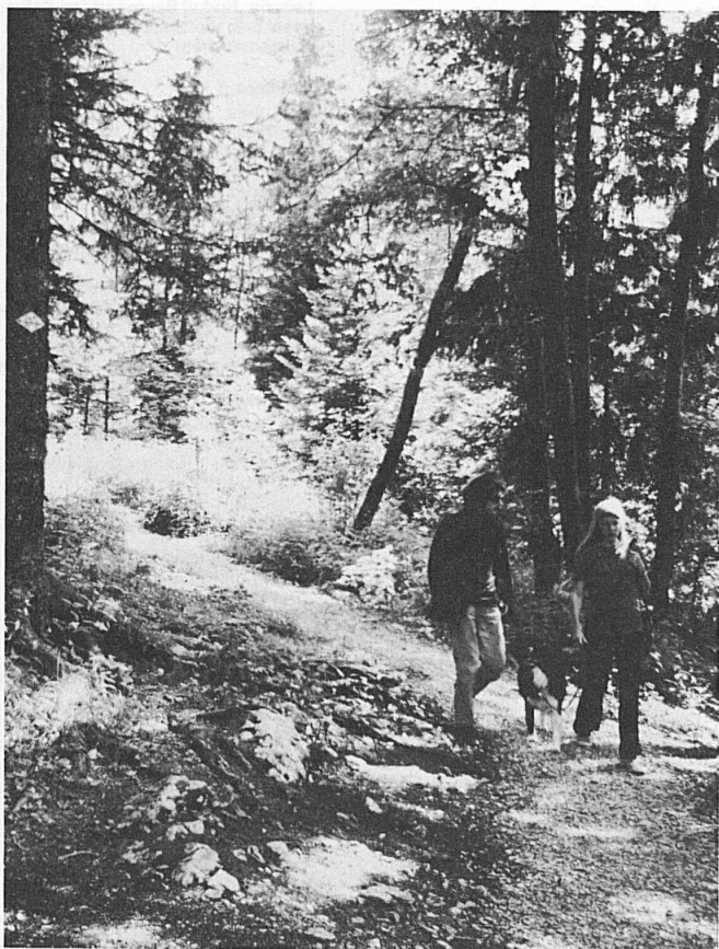
«Sentier pédestre du Jura neuchâtelois»