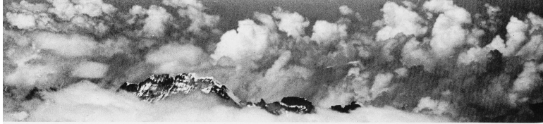
Fribourg und die Alpen. Ganz am linken Bildrand der Eisenbahnviadukt über die Saane bei Grandfey, der auch auf Seite 35 abgebildet ist