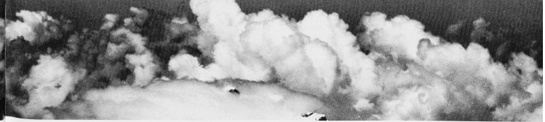
Friburgo e le Alpi. All'estrema sinistra della foto si scorge il viadotto ferroviario sulla Sarina presso Grandfey, riprodotto pure a pagina 35