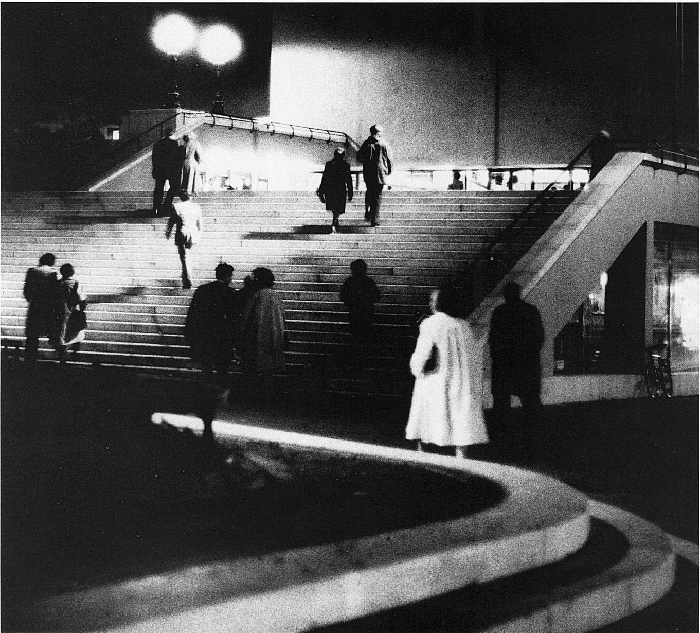
Stadttheater St. Gallen; C. Paillard, 1964 bis 1968