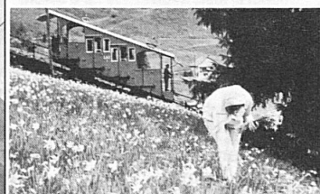
Panorama grandiose toute l'année

Les Avants-Sonloup s. Montreux Lac Léman/Genfersee