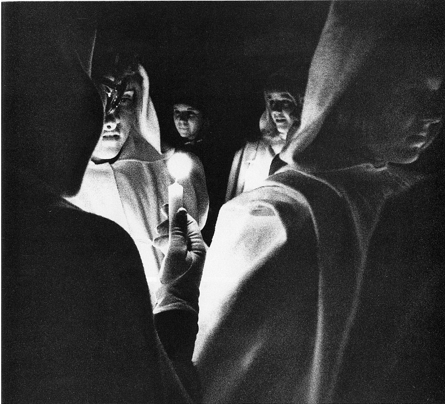
Sternsingen in Wettingen

De la vieille coutume du «Jeu des trois Rois», qui avait cours en pays catholique, est issu le «chant de l'étoile» que l'on chantait à l'origine le jour des Rois. Avec la récente renaissance de cette tradition, les cortèges, souvent accompagnés d'un choral ou d'un «Jeu de la crèche», ont été avancés et ont lieu pendant la période qui précède Noël