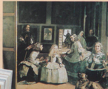
Ein begnadeter Maler: Diego Velázquez.