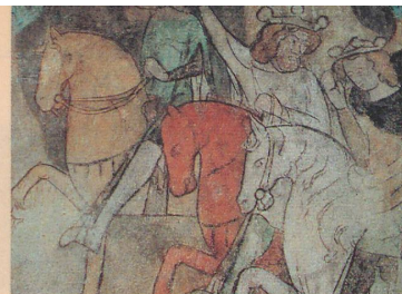
Freskenfund lockt Kunstfreunde nach Brixen.