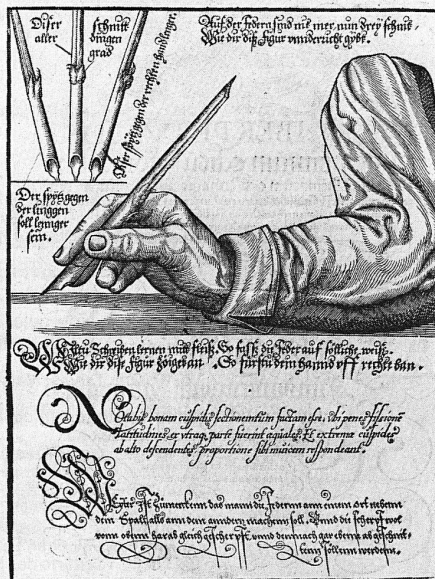
Heinrich Holtzmüller, Liber Pervtilis, 1553