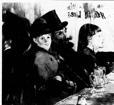
Edouard Manet, «Au café», 1878

Collezione di pitture raccolte da Vincenzo, Spartaco e Lorenzo Vela: opere lombarde, piemontesi e ticinesi, XVII al XIX secolo.