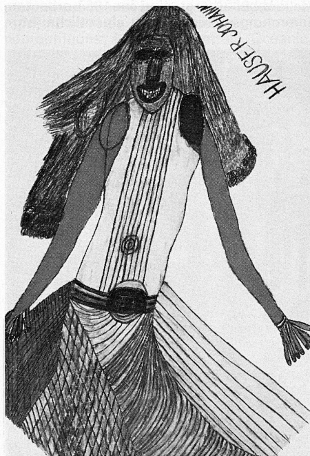
Johann Hauser: «Jeune fille en robe jaune»

The present special exhibition of the Collection de l'Art brut combines emotionally charged drawings by the artist Johann