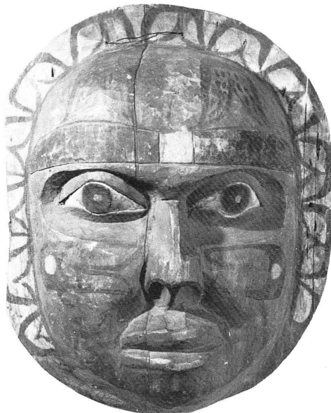
Indianische Maske, nordwestamerik. Küste

Museum Bellerive, Zürich: Marionetten Die zuvor in Lausanne gezeigte Ausstellung «Marionetten in künstlerischer Gestalt» ist bis 8. Februar im Zürcher Museum Bellerive zu sehen. Neben den Handpuppen von Paul Klee und Alexandra Exter, den mechanischen Figuren von Harry Kramer und dem