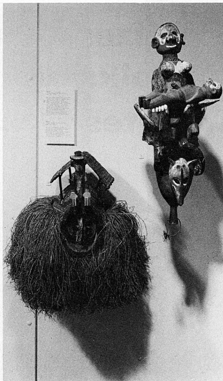
Masken aus Zaire in der Sonderausstellung «Übergänge»

En déménageant des petites salles de l'Université de Zurich dans les bâtiment rénovés de l'ancien jardin botanique sur le «Katz» (angle Talstrasse/Pelikanstrasse), le Musée d'ethnographie de Zurich a trouvé une nouvelle résidence et également de plus grandes possibilités pour exploiter un musée fonctionnant avec son époque. Heureusement, les immeubles construits au XIX e siècle au milieu de la verdure et des arbres sur le terrain des anciens remparts ont été conservés et adaptés à leur nouvel usage. Tandis que l'ancienne habitation et la serre abritent l'institut universitaire, une bibliothèque avec salle de lecture, une salle d'enseignement et des ateliers, le bâtiment de collection construit en 1864 contient le musée proprement dit, un auditoire et des salles pour des expositions itinérantes. Témoin important des constructions du XIX e siècle, la maison octogonale, où se trou-