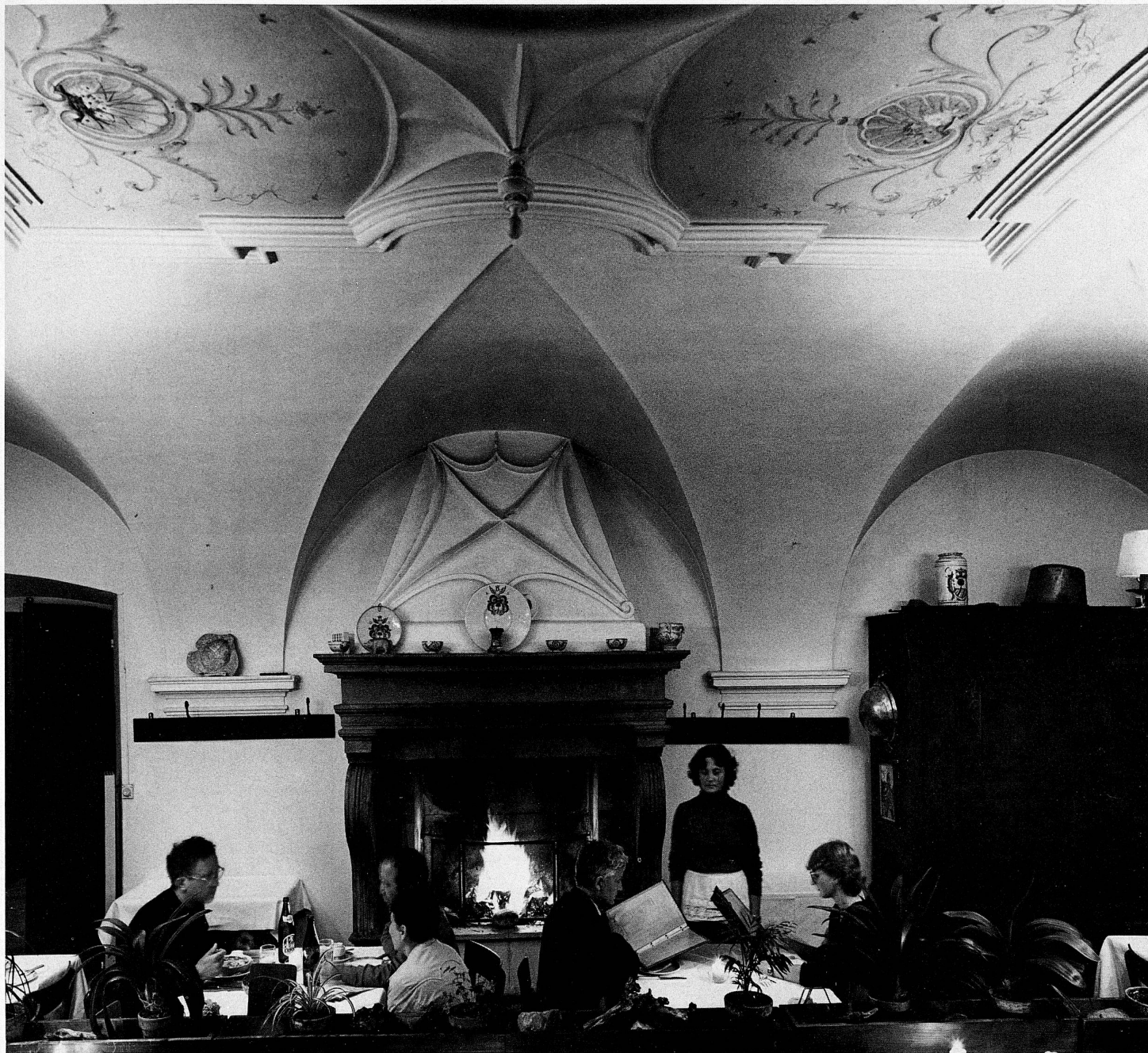
Atrio d'entrata e sala da pranzo nell'Hotel Palazzo Salis a Soglio Entrance hall and dining room in the Palazzo Salis, Soglio

Su una ripida parete della Val Bregaglia, a oltre 1000 metri sul mare, sorge il villaggio di Soglio che sin dal XIII secolo fu scelto come dimora dalla famiglia Salis la quale vi eresse parecchi palazzi maestosi. Il casato dei Salis diede i natali a numerosi uomini di Stato e ufficiali che prestarono servizio in Svizzera e all'estero. Durante i disordini nei Grigioni, il partito protestante franco-veneziano fu condotto per lo più da membri della famiglia Salis.