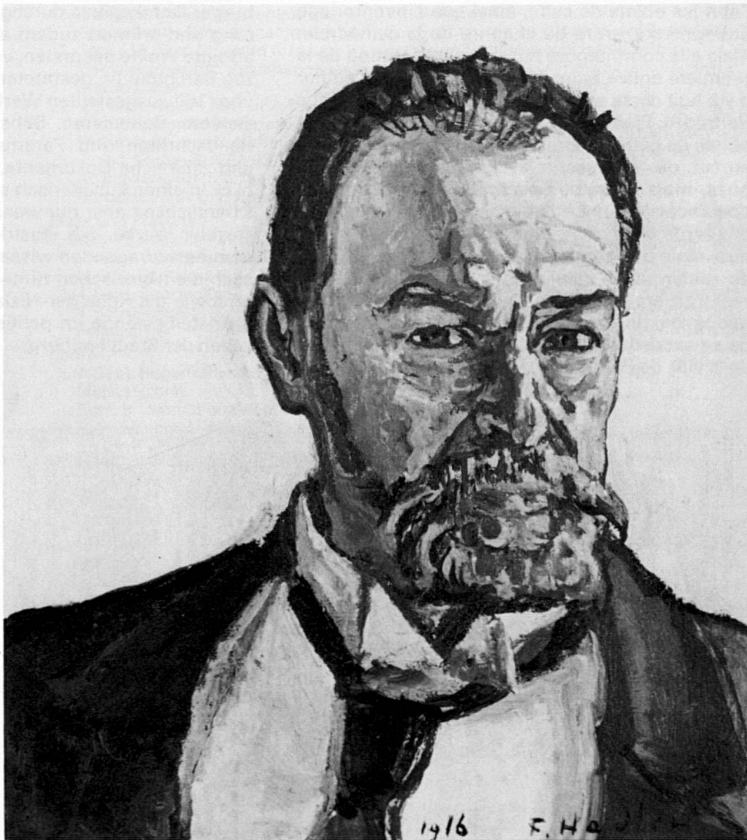
Selbstbildnis 1916. Musée d'art et d'histoire, Genève