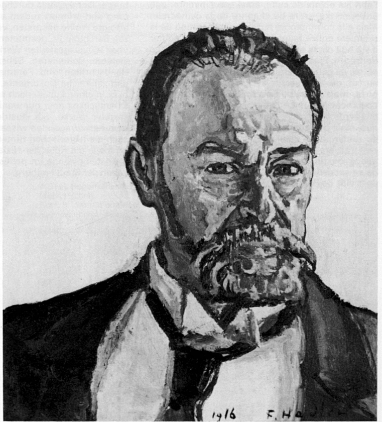
Selbstbildnis 1916. Musée d'art et d'histoire, Genève