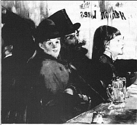
Edouard Manet, «Au café», 1878