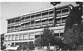
Eden Hotel****, 3700 Spiez Gepflegtes Familienhotel mit grossem Garten, Tennis und geheiztem Schwimmbad. Verlangen Sie unseren Prospekt. Telefon 033 54 11 54