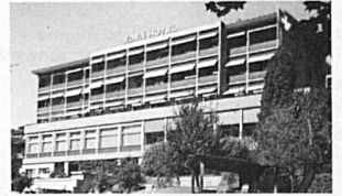
Eden Hotel****, 3700 Spiez Gepflegtes Familienhotel mit grossem Garten, Tennis und geheiztem Schwimmbad. Verlangen Sie unseren Prospekt. Telefon 033 54 11 54