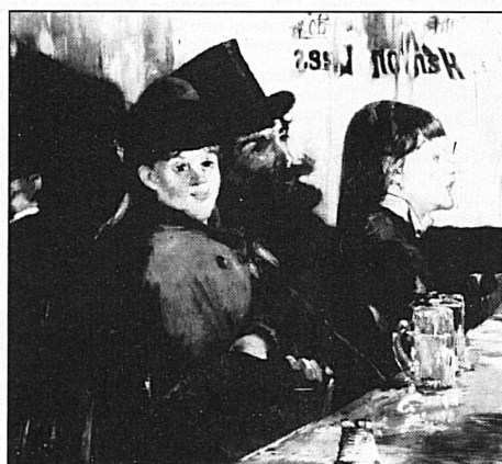
Edouard Manet, «Au café», 1878