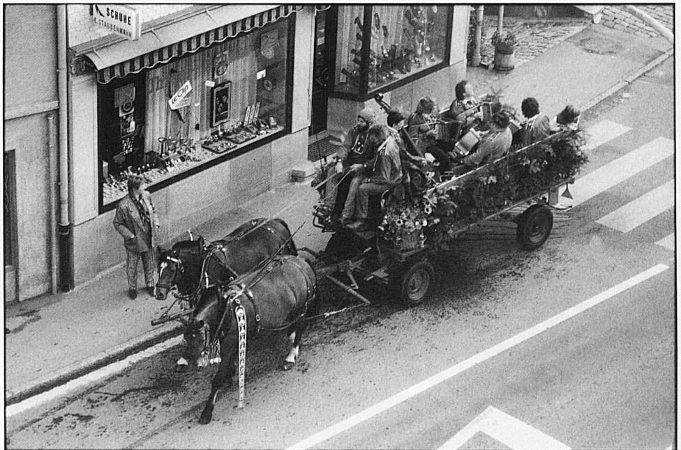
12-15 A procession from the alp passing from Sangernboden to Schwarzenburg