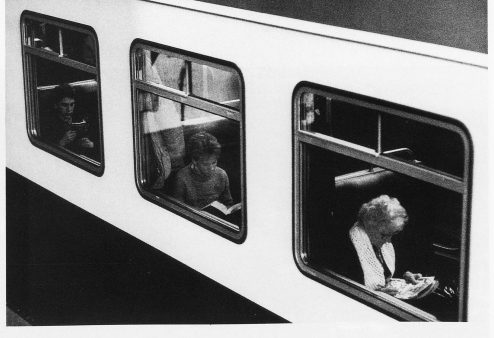
16-18 In treno da Berna a Schwarzenburg. Quando nel 1803 la signoria di Schwarzenburg venne definitivamente assegnata a Berna, la città sulle sponde dell'Aar ritenne doveroso promuovere il collegamento tra il nuovo distretto e il resto del cantone. A partire dal 1824 l'intera strada da Berna a Schwarzenburg venne aperta al traffico dei carri; nel 1831, un ponte di pietra sostituì il vecchio manufatto in legno che scavalcava il fiume Schwarzwasser. 1882 fu costruito un alto ponte di ferro che permise di evitare il faticoso cammino attraverso la gola del fiume Schwarzwasser. Infine, il 31 maggio 1907 venne inaugurata l'auspicata linea ferroviaria e il primo treno a vapore giunse a Schwarzenburg.