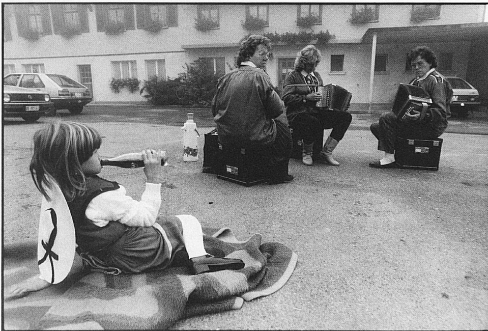
12–15 Alpabzug über Sangernboden nach Schwarzenburg