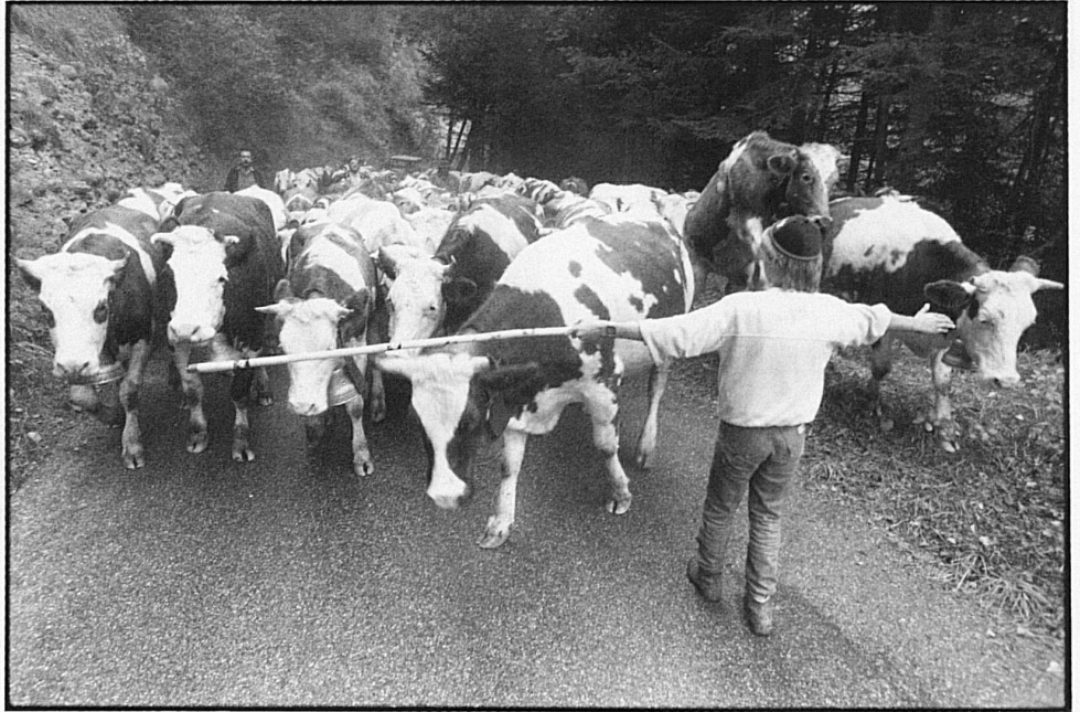
12-15 Il bestiame scende dall'alpe presso Sangernboden e attraversa Schwarzenburg