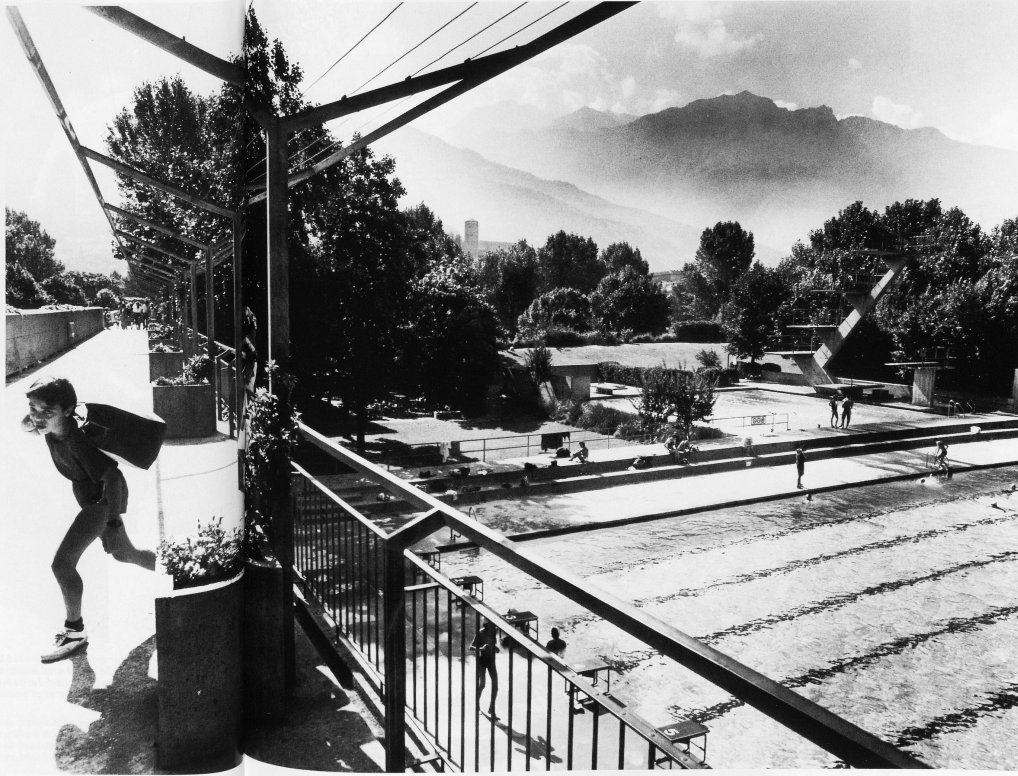
31 Schwimmbad Bellinzona / Piscine de Bellinzona / Bagno pubblico a Bellinzona / The open-air swimming pool of Bellinzona