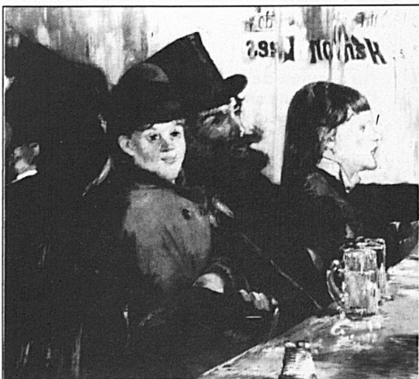
Edouard Manet, «Au café», 1878