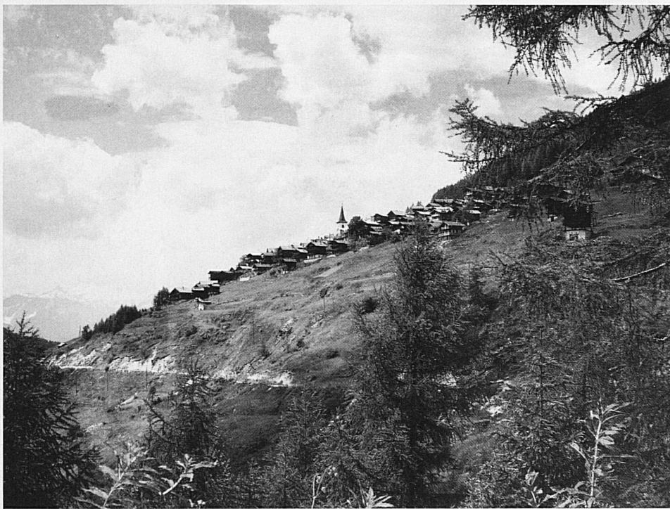
St-Luc im Val d'Anniviers St-Luc dans le Val d'Anniviers St-Luc nella valle d'Anniviers St-Luc in the Anniviers Valley