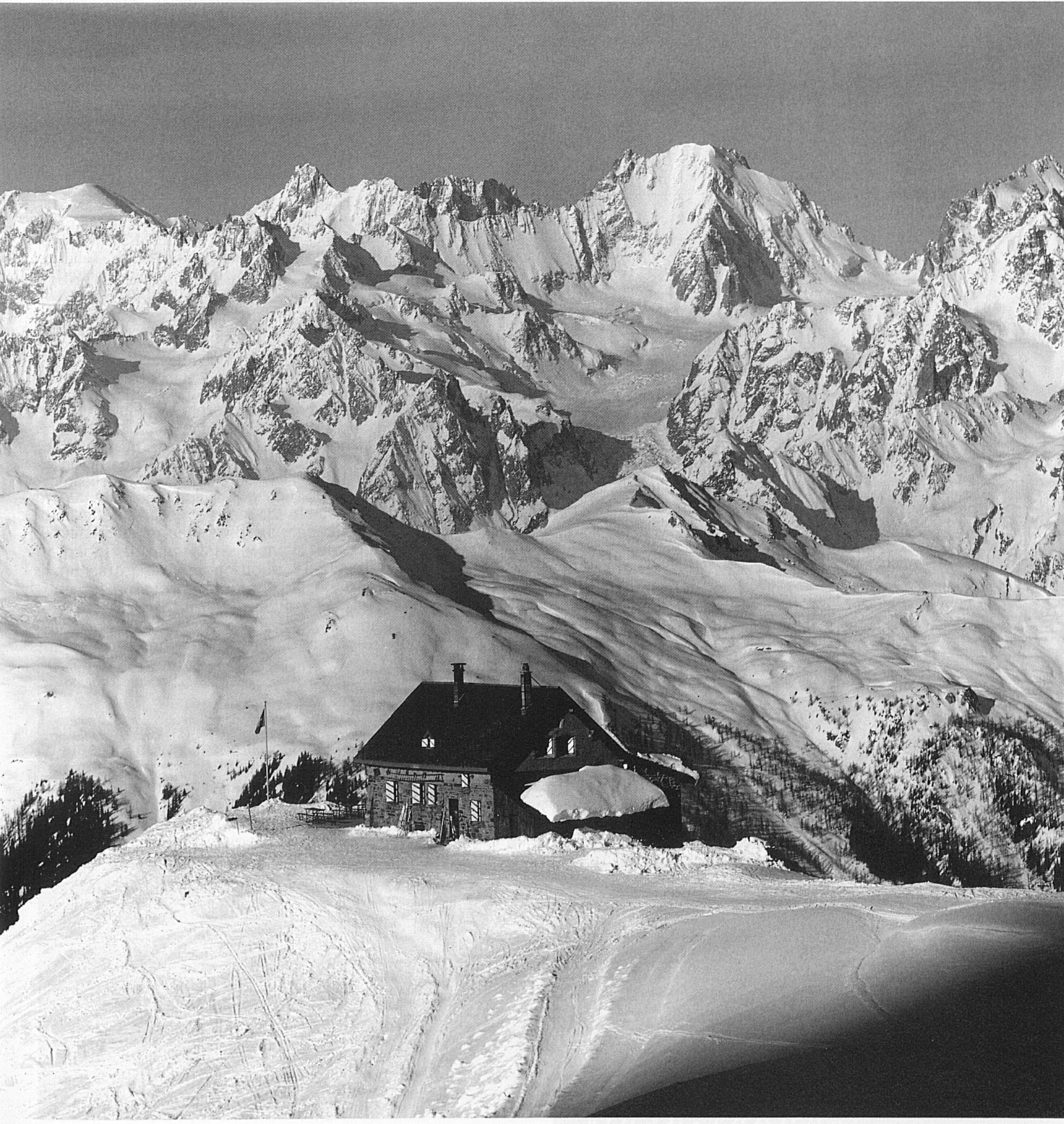
Aig. du Chardonnet 3680 m