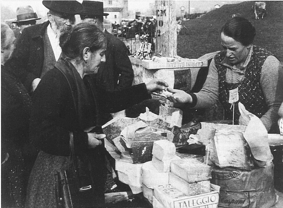
Gino Pedrolì (1898–1986): Die «Fiera di San Martino» (Martinimarkt) in Mendrisio, 30er Jahre