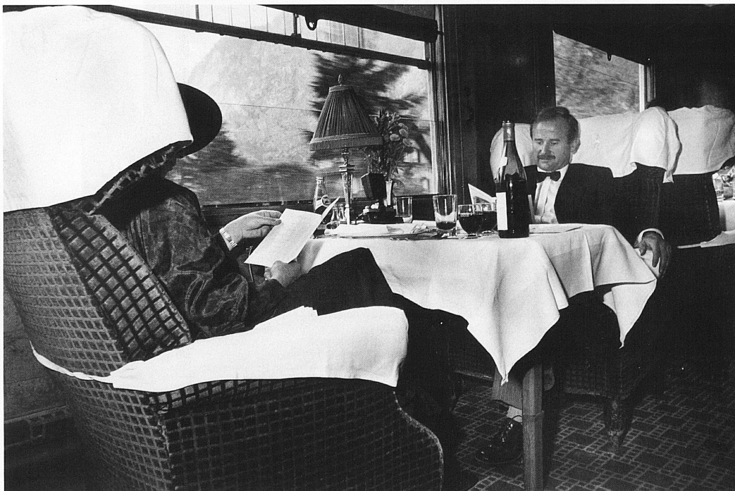
9/10 Immagini scattate durante un nostalgico viaggio con il Gotthard Pullman Express 9/10 Scenes from a nostalgic off-schedule journey in the Gotthard Pullman Express