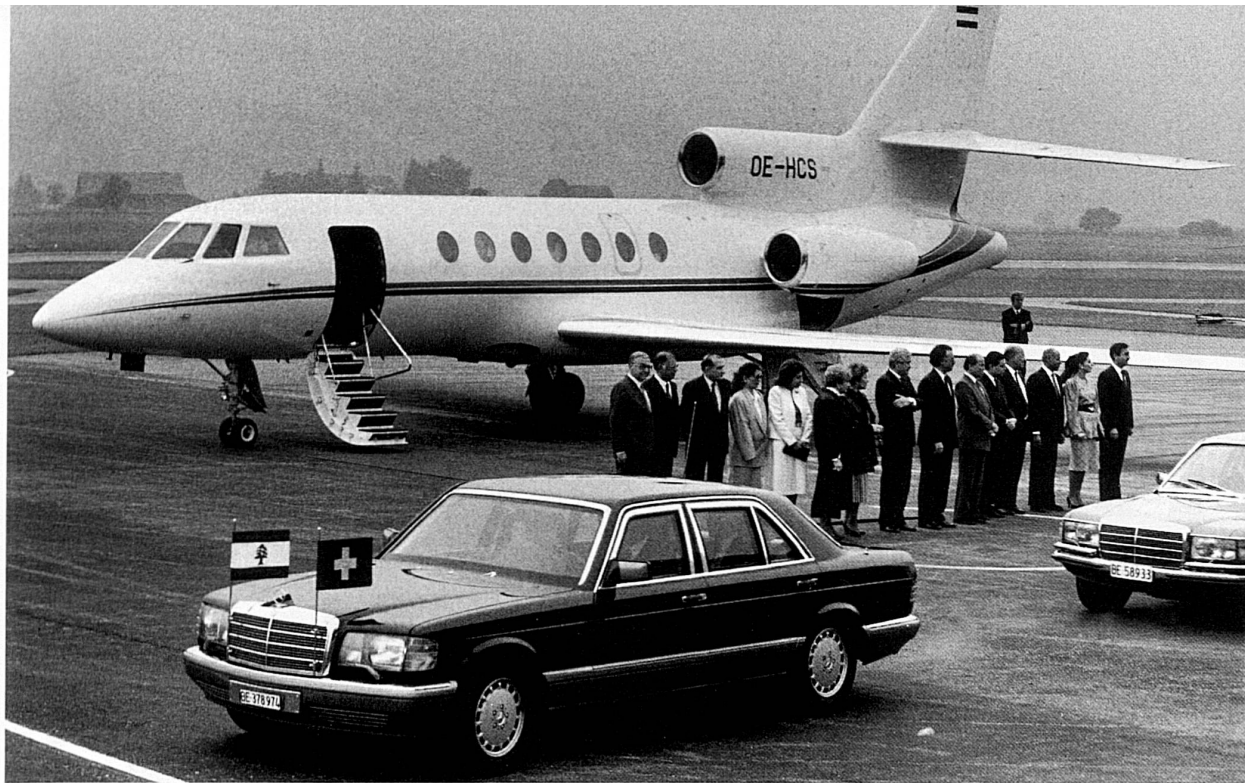
14-16 Arrivo degli ospiti all'aeroporto di Berna-Belpmoos; la scorta d'onore attraversa la Bundesgasse; ricevimento a Palazzo federale. L'organizzazione delle visite di personalità straniere è affidata al servizio del protocollo del DAE