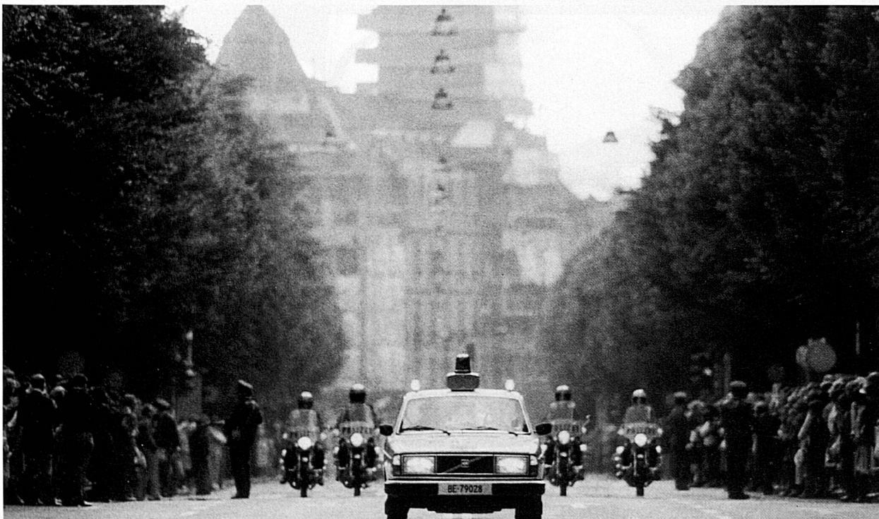
14-16 Arrival of guests at Bern-Belpmoos Airport, escort through Bundesgasse and reception in the Houses of Parliament. The Protocol Service of the Foreign Affairs Department is responsible for organizing the visits of important personages from abroad